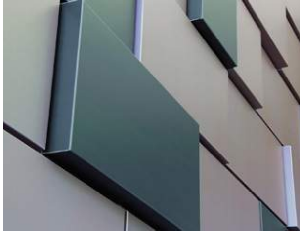
Tout type de métallurgie industrielle