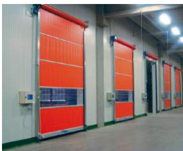
Porte roulante PVC rapide